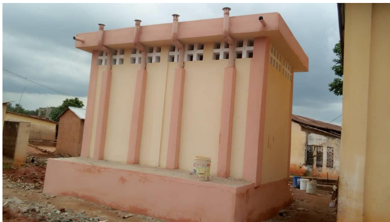
Une latrine vue de derrière avec des cheminées d'aération

La mise à disposition d'eau potable et de blocs sanitaires, la vulgarisation et l'utilisation d'infrastructures d'assainissement ainsi que la promotion des comportements en matière d'hygiène permettraient d'améliorer les conditions d'apprentissage pour ces élèves.