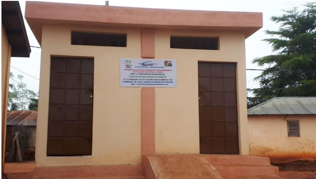
Latrine dans l'école primaire catholique de Kovié

Nous avons la satisfaction de vulgariser l'utilisation d'infrastructures d'assainissement ainsi que la promotion des comportements en matière d'hygiène pour permettre d'améliorer les conditions d'hygiène des populations fragiles.