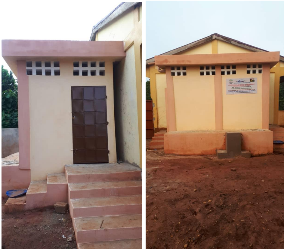
Latrines avec borne fontaine à la disposition des élèves

Nous avons la satisfaction de vulgariser l'utilisation d'infrastructures d'assainissement ainsi que la promotion des comportements en matière d'hygiène pour permettre d'améliorer les conditions d'hygiène des populations fragiles.