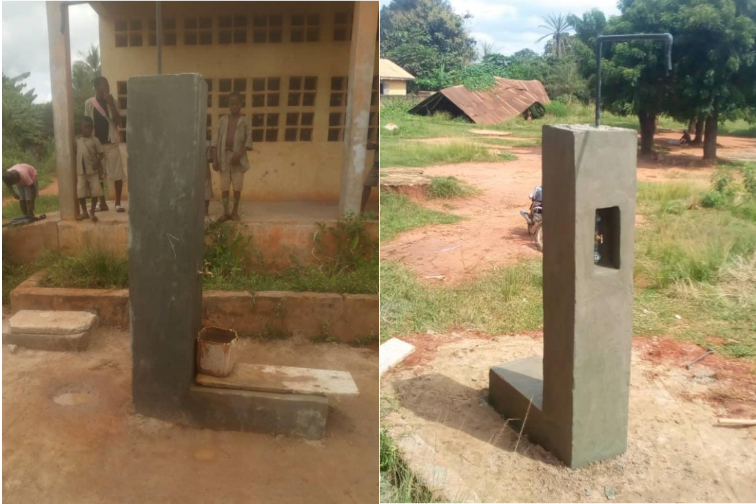
Borne fontaine dans l'école primaire publique

Aujourd'hui presque toutes les écoles primaires de Kovié ont de l'eau potable et des latrines propres. Il s'agit de l'école primaire publique et l'école primaire catholique de Kovié.